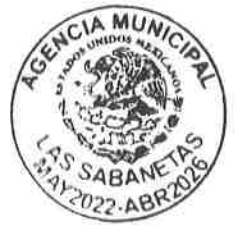
H. AYUNTAMIENTO CHACALTIANGUIS VER